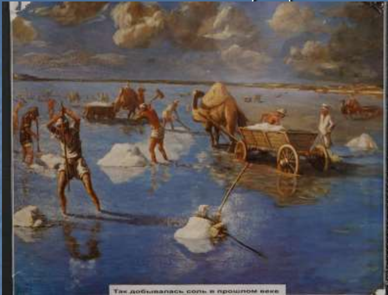
Так добывалась соль в прошлом веке